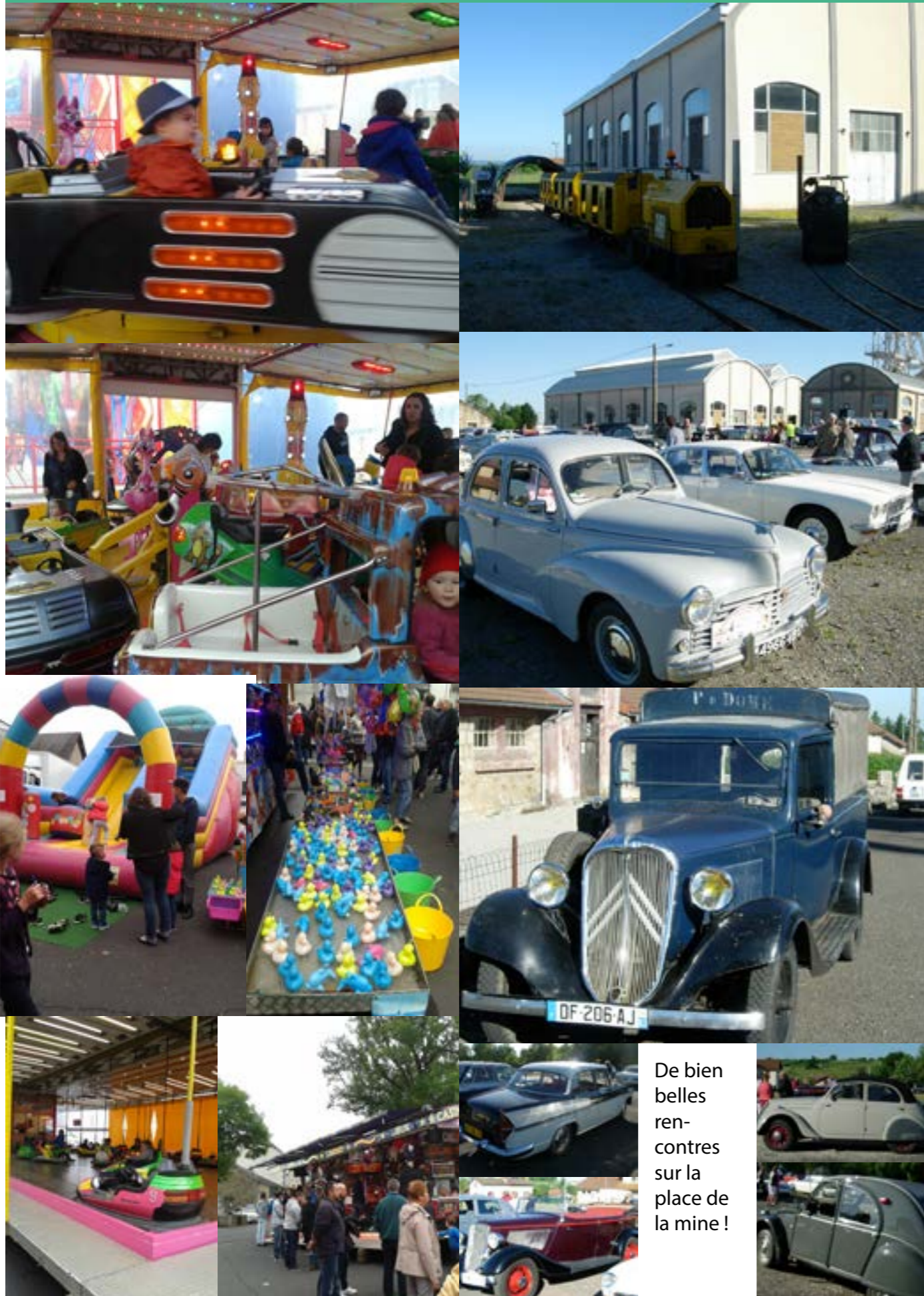
De bien belles rencontres sur la place de la mine !