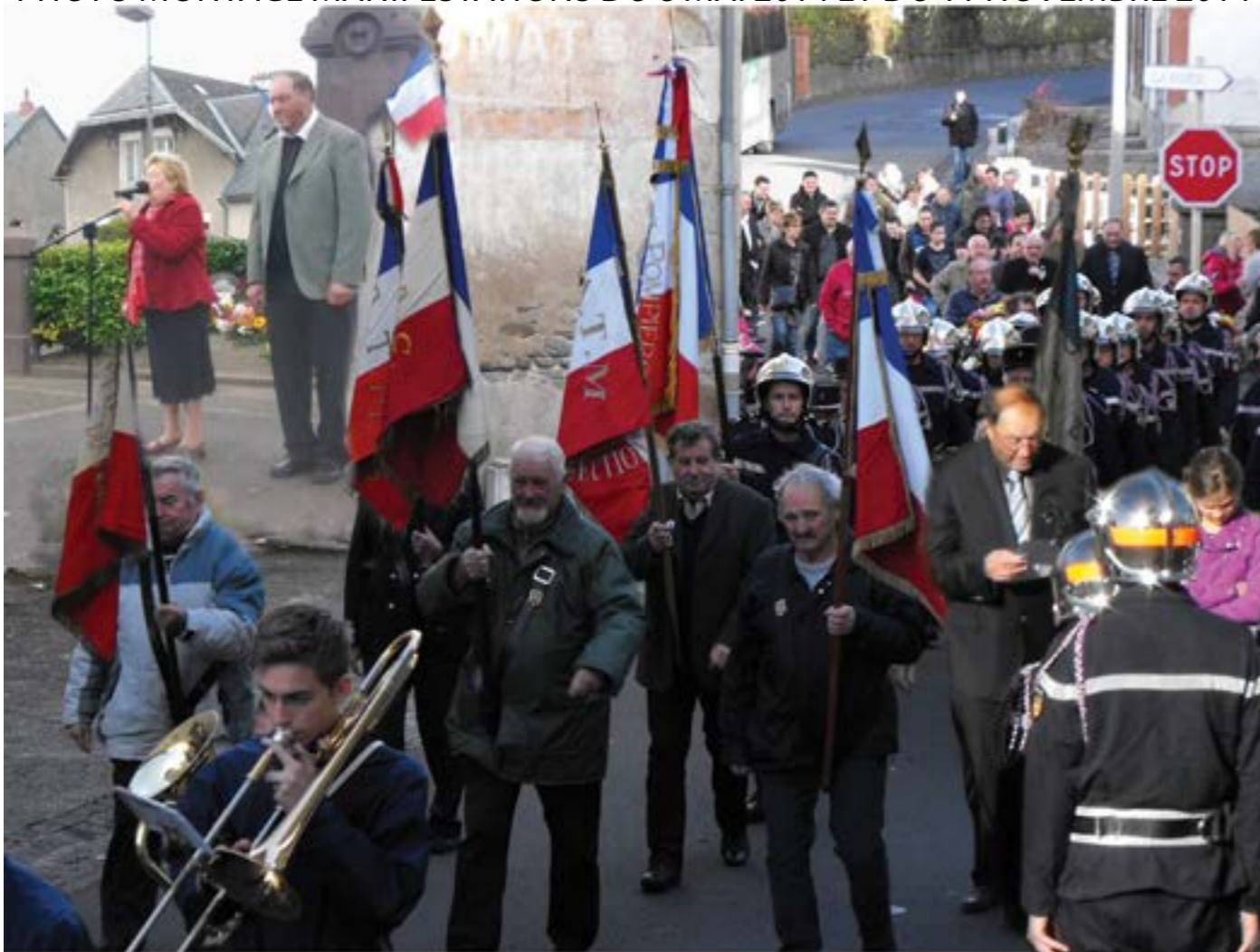
PHOTO MONTAGE MANIFESTATIONS DU 8 MAI 2014 ET DU 11 NOVEMBRE 2014

Comme tous les ans, les cérémonies nationales et le devoir de mémoire qui honorent le sacrifice de nos anciens combattants ont été honorés par un grand nombre de Messeiroix. Si, comme beaucoup d'entre nous, vous souhaitez nous accompagner dans cette démarche, nous vous donnons rendez-vous, à chaque date anniversaire, au pied du monument aux morts.