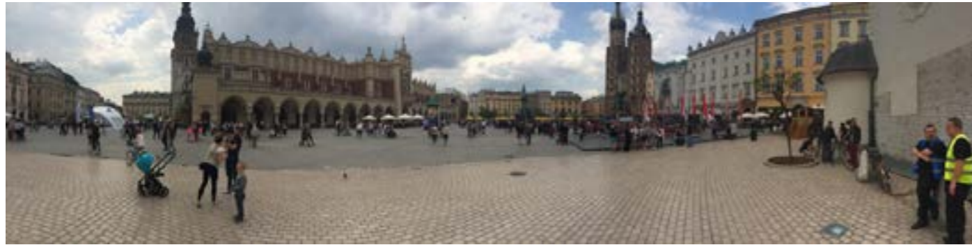
PLACE DU MARCHE PRINCIPAL DE CRACOVIE

Commençons par notre voyage en Pologne, souvenez vous, pour le 14 juillet 2013, les Sapeurs Pompiers de Slawkow nous ont fait l'honneur de défiler avec nous et de nous jouer un petit air de musique. Ces derniers nous ont invité à passer une semaine dans leur ville, nous avons donc répondu favorablement à leur demande et nous nous sommes envolés direction leur pays du 29 avril au 6 mai 2014.