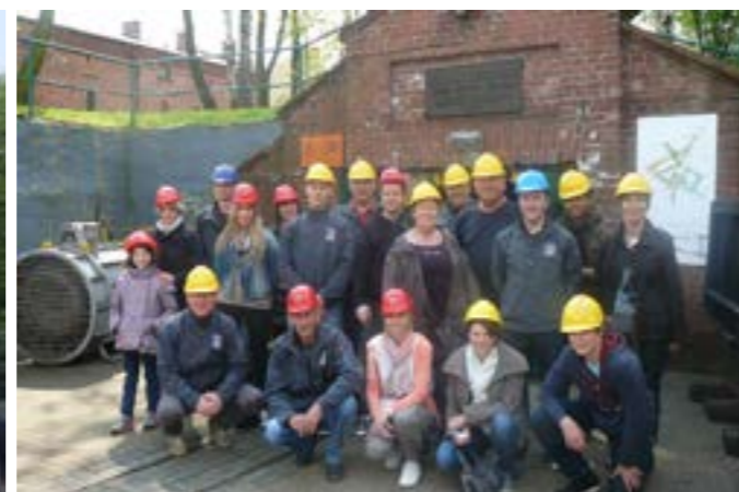
VISITE D'UNE MINE DE CHARBON