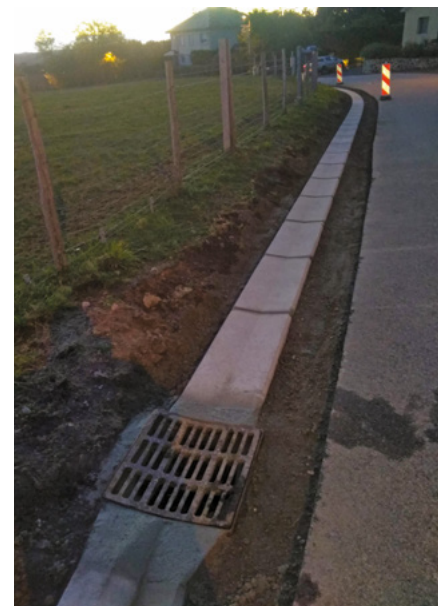
● Bordure de chaussée, rue des Tamaris

Le remplacement d'un avaloir d'eau rue des Lilas pour la somme de 420€ HT.