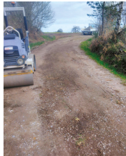
● Aménagement chemins