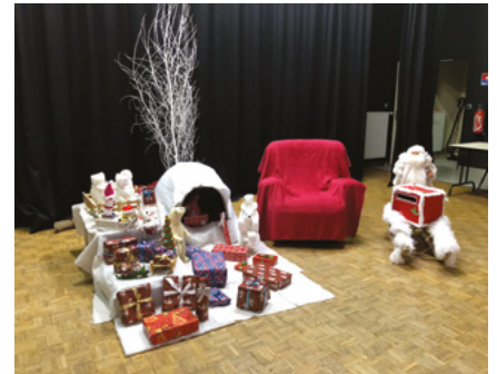
● Marché de Noël

Nous remercions nos différents partenaires qui nous assurent une aide financière et matérielle ainsi que les entreprises faisant dons de lots pour nos tombolas.