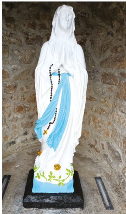
● Vierge dans le bourg