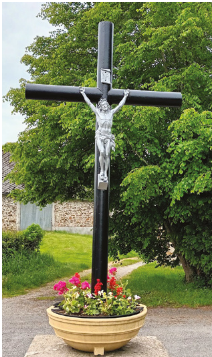
● Croix de Planchadelle

Suite à la restauration des croix dans les villages en 2022, nous souhaitons finaliser le reste des édifices religieux de la commune, un habitant nous a proposé ses services pour la remise en état de ceux-ci. Nous avons fourni le matériel nécessaire. Nous remercions chaleureusement Mr Marc MONARCHA pour ces travaux de restauration de la Vierge dans le bourg ainsi que des croix : de Planchadelle, de la route de la Brugière, de l'allée des Cerisiers, de Chez Pie, de Farvalanges, des Barans, des Gannes et des Boules.