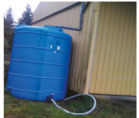
● Cuve eau de pluie

L'escalier de la cité des Tilleuls, en mauvais état, devenait dangereux. L'entreprise Alpha Services a réalisé la réfection des marches pour la somme de 1 086 € TTC.