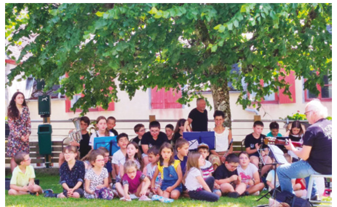
L'orchestre à l'école

L'année 2022/2023 a vu la reprise des activités : chaque enfant a pu bénéficier de 10 séances de piscine à Ussel, les plus petits ont découvert l'escrime, tandis que les grands pouvaient s'initier à l'escalade. Durant toute l'année les enseignantes ont eu à cœur de compléter