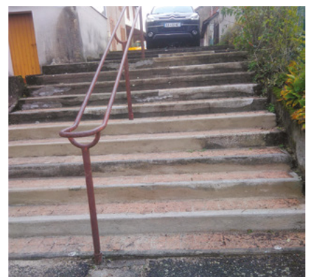
● Escalier cité des tilleuls