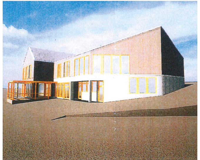
● Depuis de sud-ouest