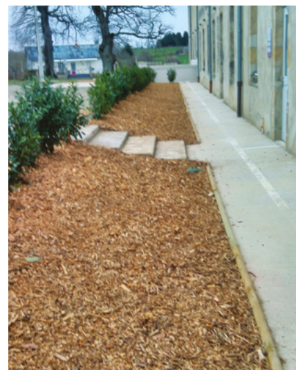
● Plaquettes forestières