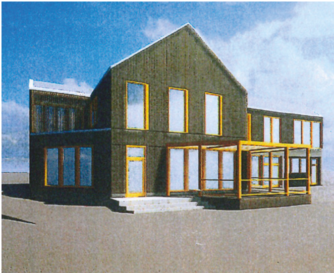
● Depuis de nord-ouest

Un regroupement d'activités est à l'étude et sera implanté dans le dépôt actuel des services techniques. Il sera composé d'une partie médicale (médecins, infirmiers, pharmacien, kinésithérapeutes...) et d'un point multi-services. Les premiers plans ont été réalisés et soumis à l'ensemble des professionnels intéressés.